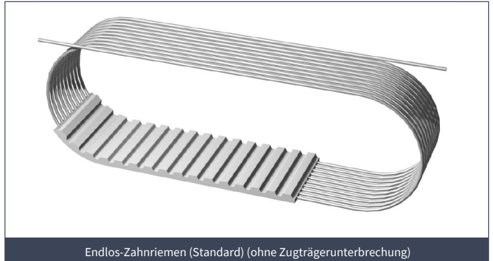
Endlos-Zahnriemen (Standard) (ohne Zugträgerunterbrechung)

Endloszahnriemen werden in Vorzugs-Kataloglängen angeboten. Unser Herstellprogramm ermöglicht ferner die Lieferung von Zwischenlängen bis zu einer Maximal-Endloslänge von 20.000 mm.